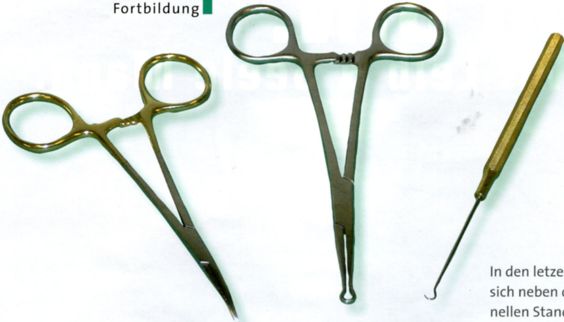
Abbildung 1: Spezialinstrumente für die No-scalpel-Vasektomie: Ringklemme, Spitzklemme und Minihäkchen